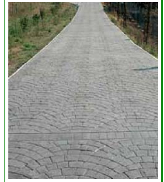
pavimento per esterno